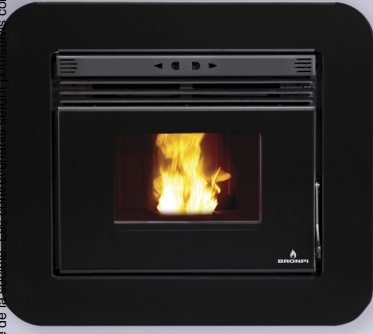
NEVA + M-94

Puerta en cristal vitrocerámico serigrafiado color negro. Screen-printed black glass door. Porta de vidro vitrocerámico serigrafada cor preta. Porta in vetro ceramico serigrafato nero. Porte en vitre vitrocéramique sérigraphiée noir.