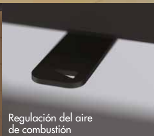
Regulación del aire de combustión